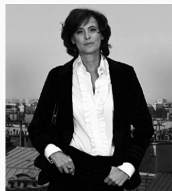
Inès de la Fressange