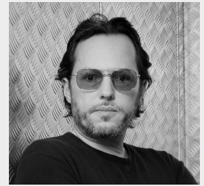
ALEXANDRE DE BETAK