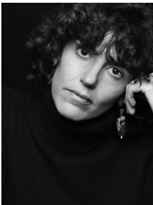
FRANCESCA BELLETTINI PRÉSIDENT & CEO, SAINT LAURENT