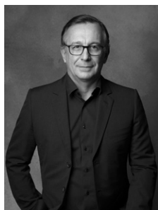
BRUNO PAVLOVSKY PRÉSIDENT DES ACTIVITÉS MODE, CHANEL