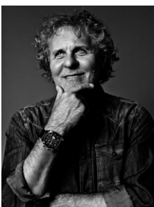
RENZO ROSSO PRÉSIDENT, OTB