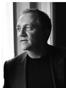
FRANÇOIS-HENRI PINAULT PDG, KERING