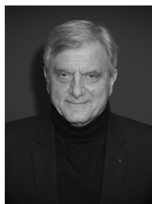
SIDNEY TOLEDANO PDG LVMH FASHION GROUP