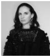
CHRISTELLE KOCHER, KOCHÉ