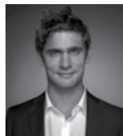
JEREMY VERDO, SMARTPIXELS