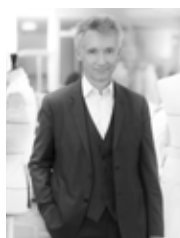
GEOFFROY DE LA BOURDONNAYE