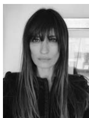
CAROLINE DE MAIGRET