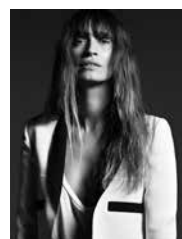
CAROLINE DE MAIGRET